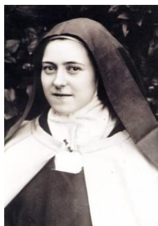
Sainte Thérèse de l'Enfant Jésus

Cette prière à sainte Thérèse de l'Enfant Jésus est très puissante pour les demandes temporelles et spirituelles. Ceux à qui nous l'avons recommandée ont également été stupéfaits par son efficacité. Nous encourageons à la réciter tous les jours.